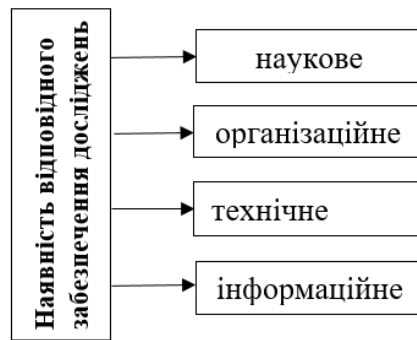
Рис. 5. Складові відповідного забезпечення експертного дослідження

Власне інформаційне забезпечення посідає провідне місце, оскільки дає можливість експерту точно описувати, класифікувати об'єкти, що підлягають дослідженню, визначити напрями подальших дій, відбирати для застосування відповідні методики. Тому актуальність питань інформаційного забезпечення судово-товарознавчої експертизи залишається високою [10].