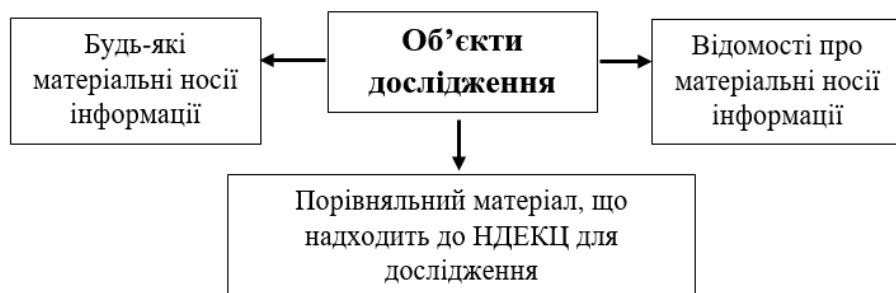
Рис. 2. Узагальнені об'єкти експертного дослідження

Об'єктами експертного дослідження або судової експертизи стають матеріальні носії інформації – документи, зразки, речовини, програми або інші дані про них і порівнювальний матеріал – об'єкт порівняння, що надходить до науково-дослідних експертно-криміналістичних центрів [4] (рис. 2).