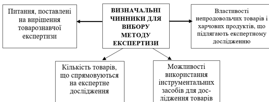
Рис. 3. Чинники, що мають визначальне значення під час вибору методів для експертних досліджень

Оцінювання майна проводиться із застосуванням методичних підходів, методів оцінювання, що є складовими частинами методичних підходів або є результатом комбінування кількох методичних підходів, а також оціночних процедур [5]. Під час вибору методу для експертних досліджень, призначених за конкретною справою, визначальне значення мають чинники, наведені на рис. 3.