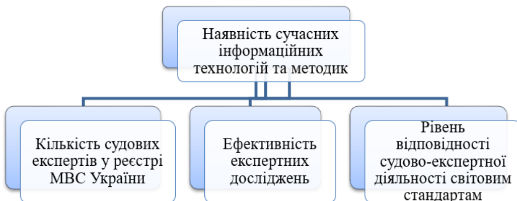
Рис. 1. Чинники, що забезпечують ефективність товарознавчо-експертної діяльності в судовій практиці

Об'єктами експертного дослідження або судової експертизи стають матеріальні носії інформації – документи, зразки, речовини, програми або інші дані про них і порівнювальний матеріал – об'єкт порівняння, що надходить до науково-дослідних експертно-криміналістичних центрів [4] (рис. 2).