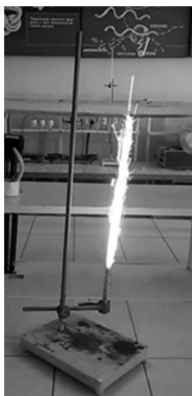
Рис. 4. Фотографічне зображення зразка піротехнічних виробів під час експлуатації

Радіус польоту іскор піротехнічних побутових виробів визначали, розрахувавши масштабний коефіцієнт, що є відношенням довжини рейки 0,75 м до довжини зображення рейки на фотографії 190 мм, і становив 3,95. Вимірювання значень здійснювали на фотографіях, що були отримані під час знімання зразків до та у процесі експлуатації (рис. 4).