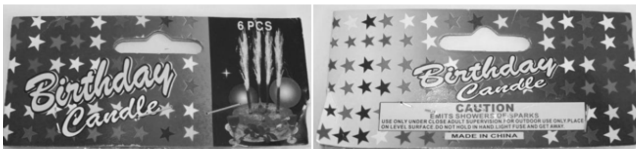
Рис. 2. Фотографічне зображення фрагмента маркування на лицевій і зворотній стороні затискача

– на зворотній стороні затискача (рис. 2): написи Birthday Candle; CAUTION; Emits showers of sparks; Use only under close adult supervision. For outdoor use only. Place on level surface. Do not hold in hand. Light fuse and get away; Made in China (Свічки до дня народження; УВАГА; Випускає потоки іскор; Використовуйте тільки під пильним наглядом дорос-