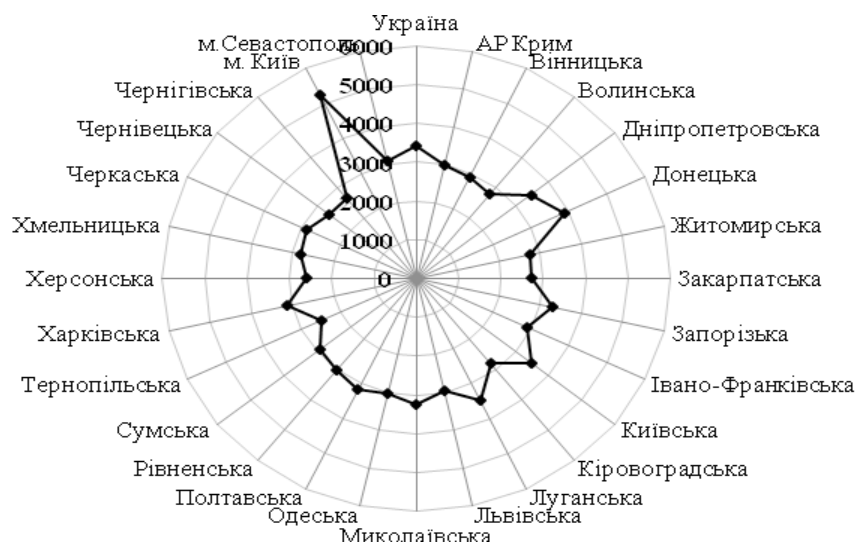
Рис. 1. Диференціація заробітної плати в областях України у липні 2013 р. [4]

Аналізуючи офіційні дані державного комітету статистики по середньомісячній заробітній платі за липень 2013 р., виявили значну міжрегіональну диференціацію в її розмірах (рис. 1).