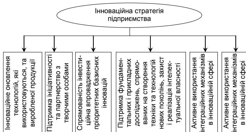
Рис. 3. Ознаки інноваційно-орієнтованої стратегії підприємства (складено на основі [8, с. 309])

є їх перехід на інноваційну основу функціонування. Зокрема, це диктує необхідність пошуку нових джерел енергії, шляхів зниження собівартості продукції при збереженні належного рівня якості продуктів і послуг. Складнощі такого підходу до управління в сучасних умовах пов'язані з: