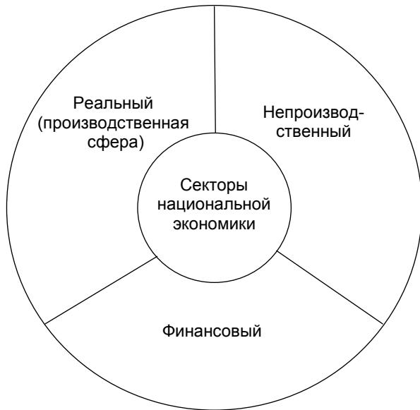
Рис. 1. Секторы национальной экономики, в зависимости от вида экономической деятельности (классификация 1) (составлено автором на основе [21])

Второй подход, как и первый, предусматривает существование трех секторов в экономике, но по нашему мнению характеризуется большей обоснованностью. В частности, к так называемому первичному относят прежде всего отрасли, связанные с добычей и переработкой сырья в полуфабрикаты, а также сельское хозяйство, рыболовство, лесоводство и охоту. Общество, существующее в условиях господствующего первичного сектора экономики, называют аграрным. Ко вторичному сектору экономики причисляют обрабатывающую промышленность и строительство. Общество, где они доминируют принято называть индустриальным. К третичному относят сферу услуг (торговля, транспорт, связь, финансовые организации, туризм, здравоохранение и т. п.). Общество, существующее в условиях господствующего третичного сектора экономики, определяют как постиндустриальное [10]. Иллюстрацией к вышесказанному может быть рис. 2.