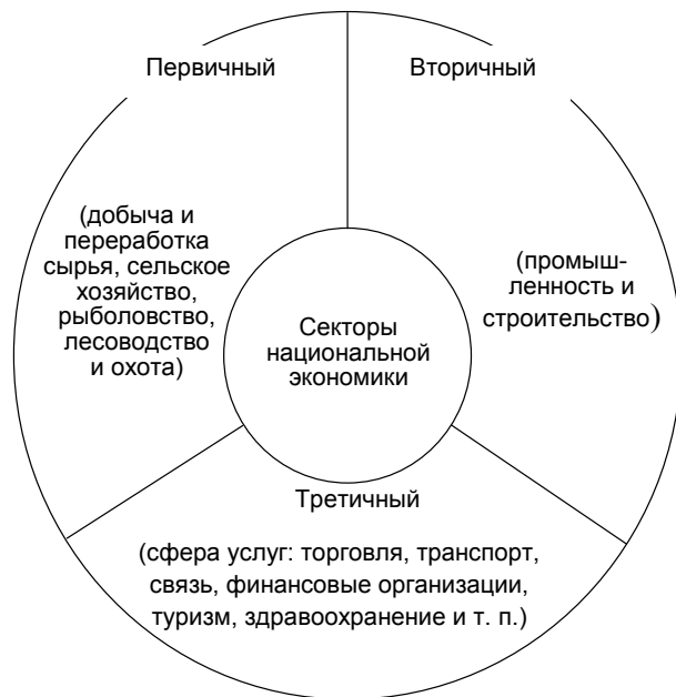
Рис. 2. Секторы национальной экономики, в зависимости от вида экономической деятельности (классификация 2) (составлено автором на основе [10])

на рынке. Их цены, оказывают значительное влияние на спрос на эти товары или услуги, а также запасы готовой продукции. При этом некоммерческий сектор предлагает товары и услуги, предназначенные для использования непосредственно производителями или владельцами предприятия, или кооператива [13, с. 12].