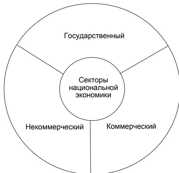
Рис. 3. Секторы национальной экономики, в зависимости от связи с рынком (составлено автором на основе [13, с. 12])