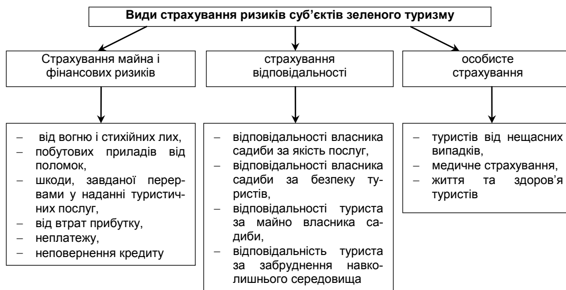
Рис. 2. Можливі види страхування ризиків суб'єктів зеленого туризму

З огляду на види ризиків, що виникають у суб'єктів зеленого туризму, таке страхування слід розглядати як сукупність страхування майна, страхування відповідальності та особистого страхування (рис. 2).