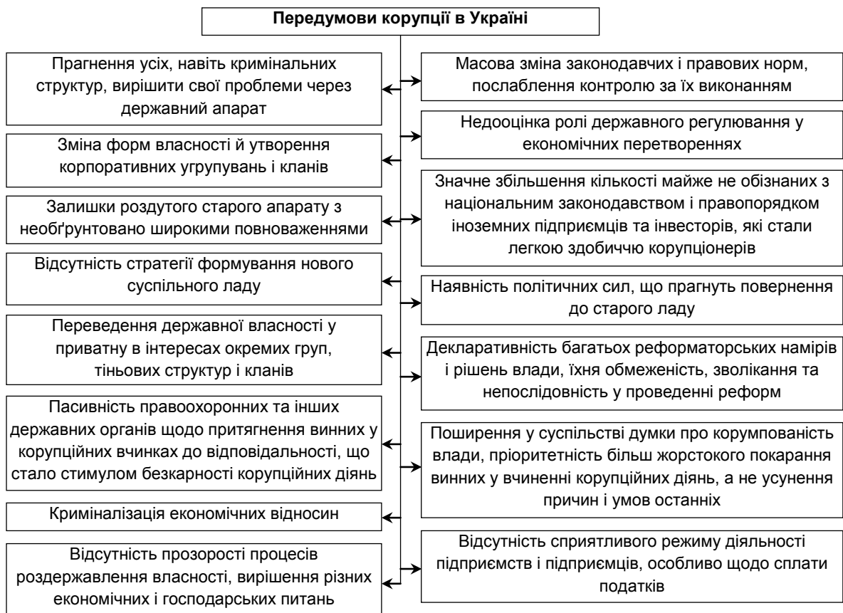
Рис. 1. Основні передумови корупції в Україні [1; 11, с. 1]

Наявність і процвітання усіх чотирьох типів корупції в Україні є свідченням того, що українська корупція є системною. На відміну від розвинених країн, де корупція часто вражає лише одну складову частину політики – впливову спілку чи політичну партію, наприклад. Україна ж є менш захищеною (на межі з повною незахищеністю, що є усвідомленою і провокованою) системою інститутів і «охоронними організаціями», що дозволяє більшості тих, хто має «доступ до корумпованого тіла», використовувати його для виживання, а привілейованій меншості – продовжувати своє збагачення [1, с. 3–4]. Передумови корупції в Україні детально подано на рис. 1: