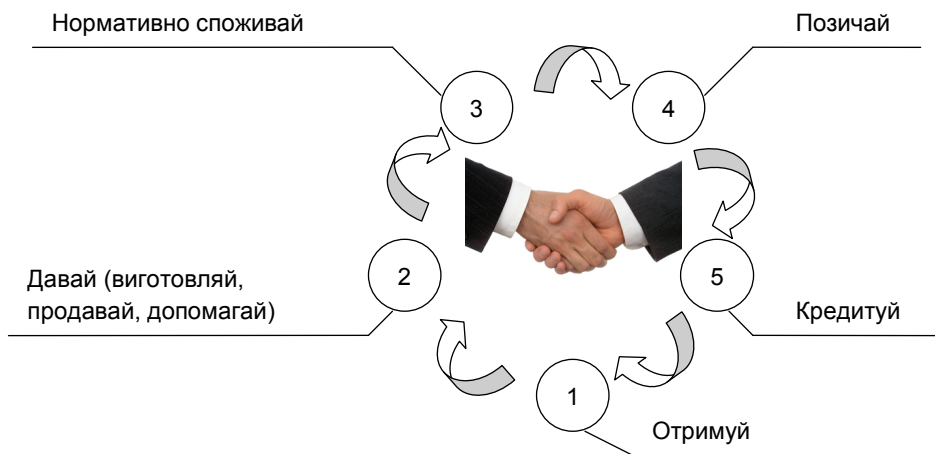
Рис. 1. Схема правила «золотого ланцюжка» (розроблено авторами на основі [2])

нах один по відношенню до одного, прагнучи до збільшення вхідних грошових потоків. При цьому ефективним є дотримання правила «золотого ланцюжка» (рис. 1).