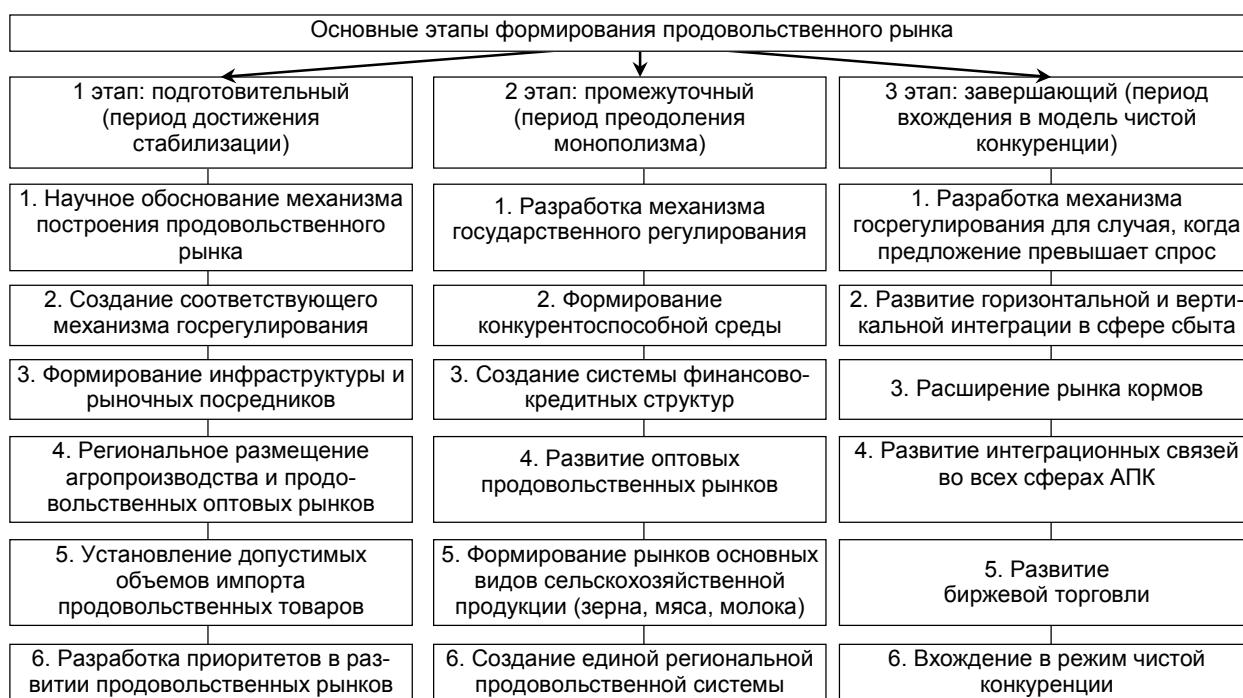
Рис. 2. Алгоритм формирования продовольственного рынка

На первом этапе формирования продовольственного рынка целесообразно сформировать систему связей между производителями и потребителями.