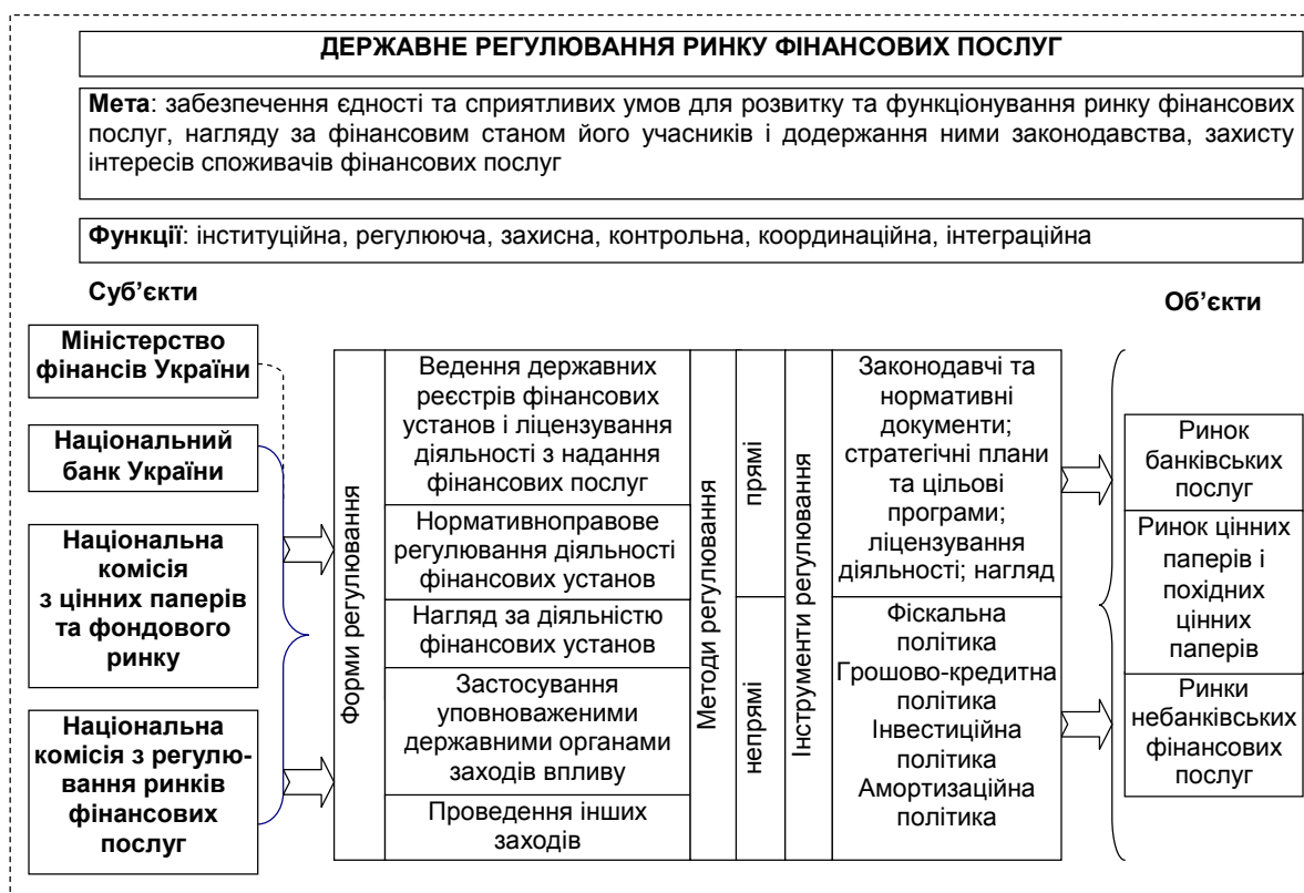
Рис. 2. Механізм державного регулювання ринку фінансових послуг України (доопрацьовано автором на основі [1, с. 42])

Розділяючи наведену вище думку, вважаємо, що доцільно з'ясувати основні структурні елементи механізму державного регулювання ринку фінансових послуг України. Його структурно-логічну схему можна подати у такому вигляді (рис. 2) [1, с. 42].