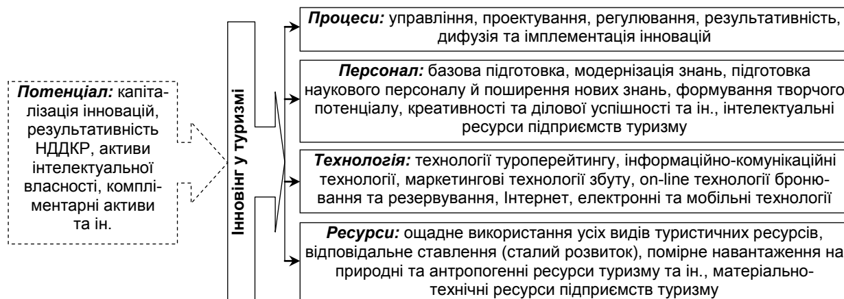
Рис. 2. Об'єкти інновіngu в туризмі

До об'єктів інновіngu як процесу оснащення людей знаннями, бажаннями, можливостями про переваги творчої поведінки для виживання в умовах жорсткої конкуренції належать: процеси як система покрокового управління виробництвом, персонал як інтелектуальний капітал підприємства, технологія як методологія виробничих процесів, ресурси як джерело виробництва інноваційного турпродукту, потенціал знань і вмінь, виробничих компетенцій туристичного підприємства (рис. 2).