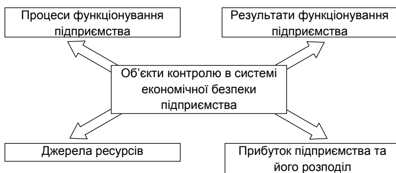
Рис. 2. Об'єкти контролю в системі економічної безпеки підприємства

Окреслимо зміст об'єктів контролю в системі економічної безпеки підприємства.