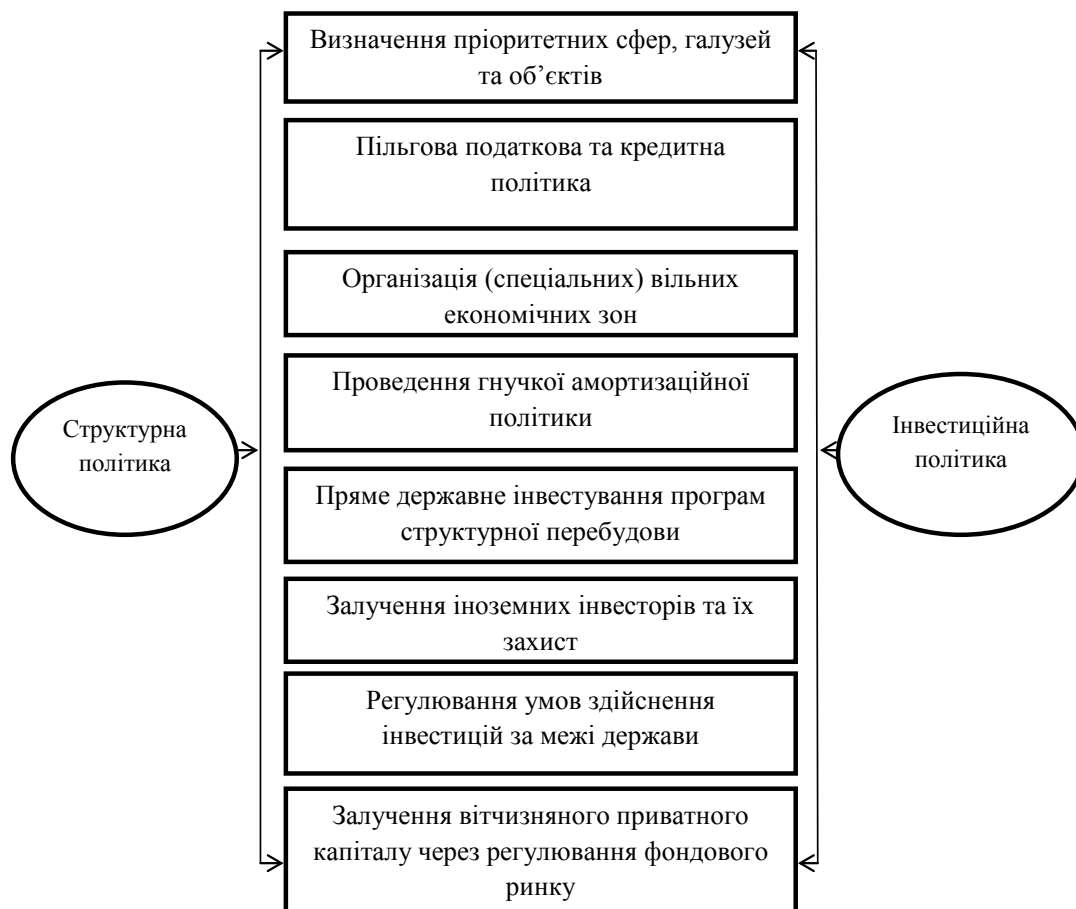
Рис. 2. Правові, адміністративні та економічні заходи інвестиційної та структурної політики