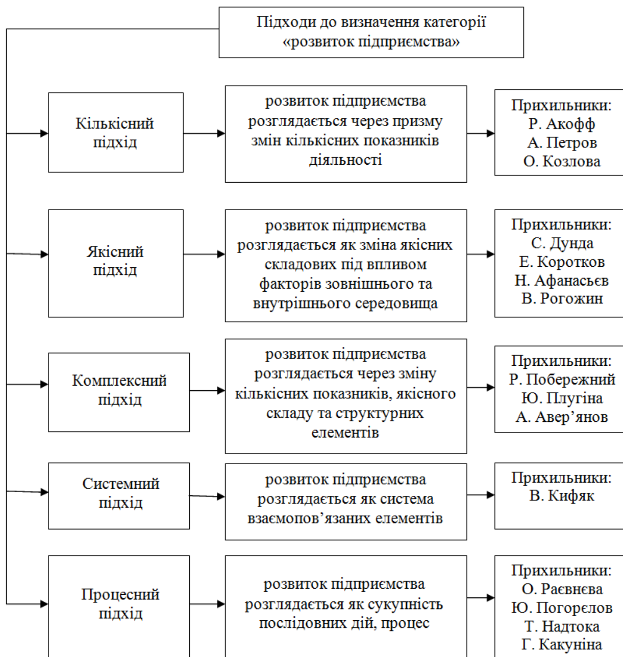
Рис. 1. Підходи до визначення розвитку підприємства

У результаті аналізу визначення розвитку підприємства, наданого сучасними науковцями, можна виділити п'ять підходів до трактування даної категорії (рис. 1).