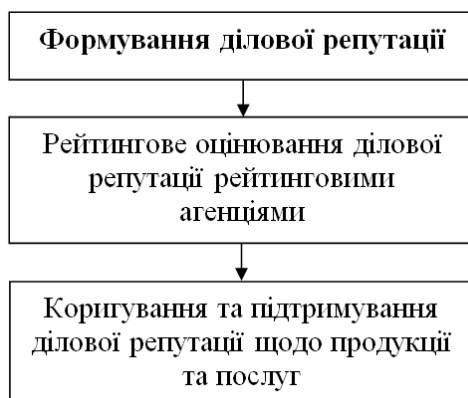
Рис. 3. Етапи управління діловою репутацією

Узагальнюючи запропоновані підходи, виділимо три основні послідовні етапи управління діловою репутацією підприємства для забезпечення його успішного функціонування на товарному ринку (рис. 3).