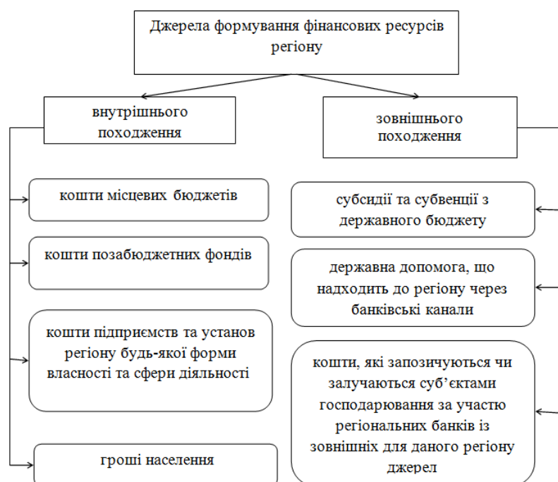
Рис. 2. Джерела формування фінансових ресурсів регіону

Джерела формування фінансових ресурсів регіону поділяються на джерела внутрішнього й зовнішнього походження (рис. 2).