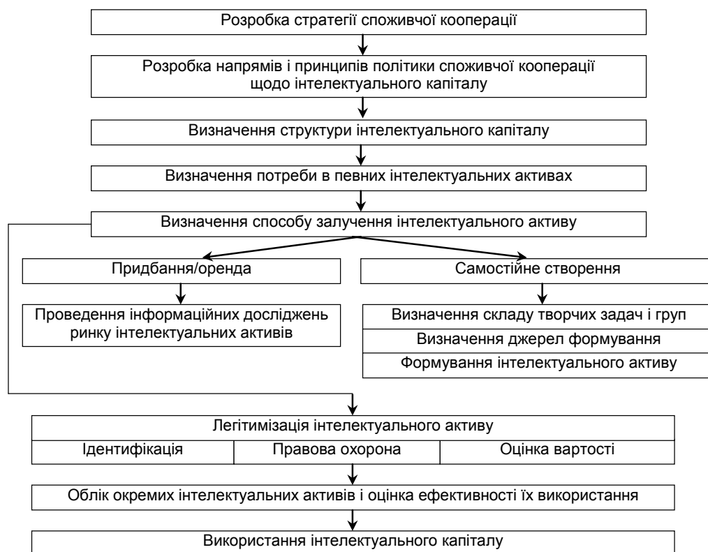
Рис. 1. Модель управління формуванням інтелектуального капіталу в системі споживчої кооперації України (складено автором на основі [1, 2])

Послідовність етапів управління згідно з моделлю (див. рис. 1) конкретизовано відображає зміст дій, що спрямовані на формування інтелектуального капіталу на всіх рівнях системи споживчої кооперації. Після з'ясування принципів підходів до визначення політики формування інтелектуального капіталу постає питання щодо його структури.