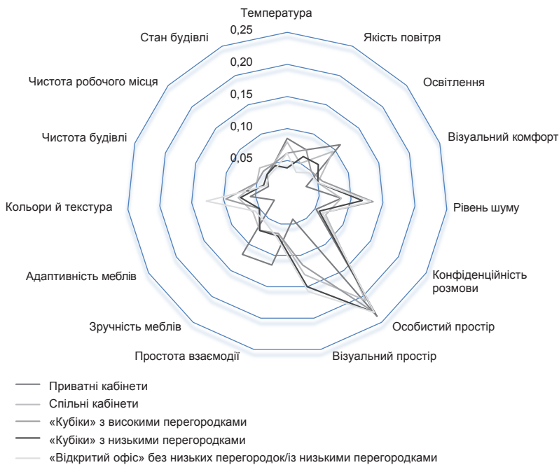
Рис. 2. Фактори, які визначають комфортність офісу для працівників [7]

щує значення інших показників. Найменш важливими виявилися чистота будівлі та чистота безпосередньо робочого місця.