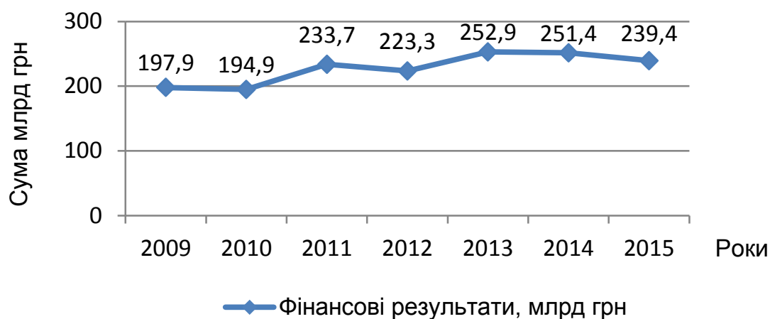
Рис. 2. Показники фінансових результатів за продукцією сільського господарства по Україні, 2009–2015 рр.

рування агровиробників. Фінансові результати до оподаткування за продукцією сільського господарства в Україні відображено на рис. 2.