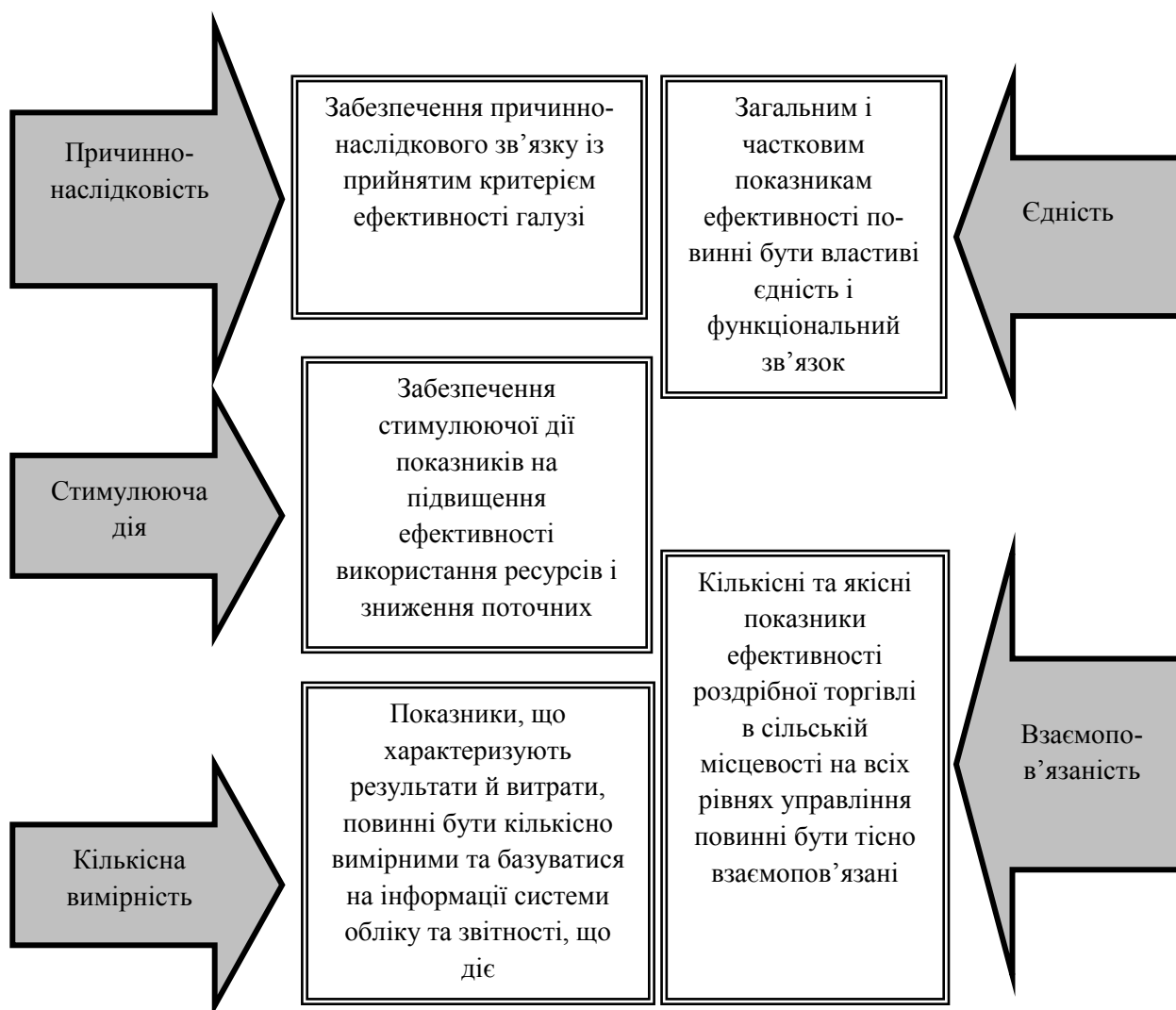
Рис. 2. Вимоги до формування системи показників оцінки ефективності функціонування підприємств роздрібно́ї торгівлі споживчої кооперації в сільській місцевості [розроблено автором на основі 1, 6, 7]

ефективність необхідно обчислювати з урахуванням використання всіх наявних у галузі ресурсів у взаємозв'язку з поточними витратами — витратами обігу. Варто зазначити, що в торгівлі здійснюються окремі операції, які продовжують процес виробництва, сприяють збільшенню споживчої вартості або її збереженню. Крім того, предмети праці споживаються і за суто торговельних операцій. У торгівлі необхідно використовувати показники, які характеризують рівень якості торговельного обслуговування споживачів.