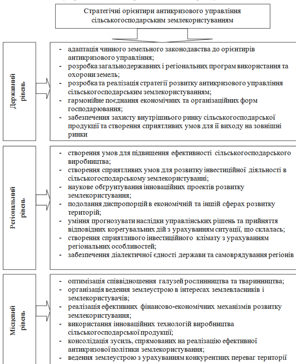
Рис. 2. Стратегічні орієнтири антикризового управління сільськогосподарським землекористуванням

При цьому базові концептуальні положення антикризового управління сільськогосподарським землекористуванням мають базуватися на таких орієнтирах, як цінність прав приватної власності на землю, ефективність форм та методів землекористування, організація сприятливого інвестиційного клімату в сільському господарстві, удосконалення орендних відносин, прогнозування розвитку сільськогосподарського землекористування з використанням методу форсайт, створення ефективної системи державного регулювання режиму землекористування.