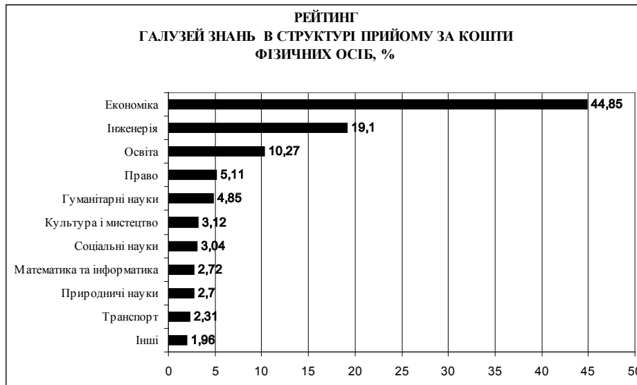
Рис. 1. Рейтинг галузей знань у структурі прийому до ВНЗ за кошти фізичних осіб у 2010–2011 навчальному році

Найвищою межею у віковому складі контингенту студентів було 35 і більше років – 44,3 тис. осіб.