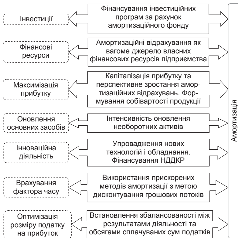
Рис. 3. Напрями впливу амортизації на діяльність підприємства

нематеріальні активи, то нарахування амортизації не здійснюється у контексті інвестиційного розвитку.