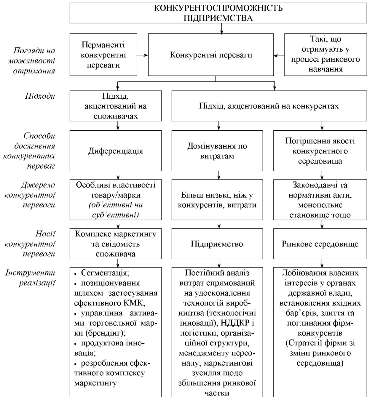
Рис. 4. Структура заходів для посилення конкурентоспроможності підприємства (розробка автора)

Підхід, акцентований на споживачах, передбачає, що фірма отримує конкурентні переваги у разі, якщо її товари кращі, ніж товари конкурентів, задовольняють потреби споживачів. З огляду на це, вважається, що цей підхід є більш задовільним із погляду концепції маркетингу. Щоб його застосувати, фірмі слід сконцентруватися на потребах споживачів, застосувавши методи, які працюють із