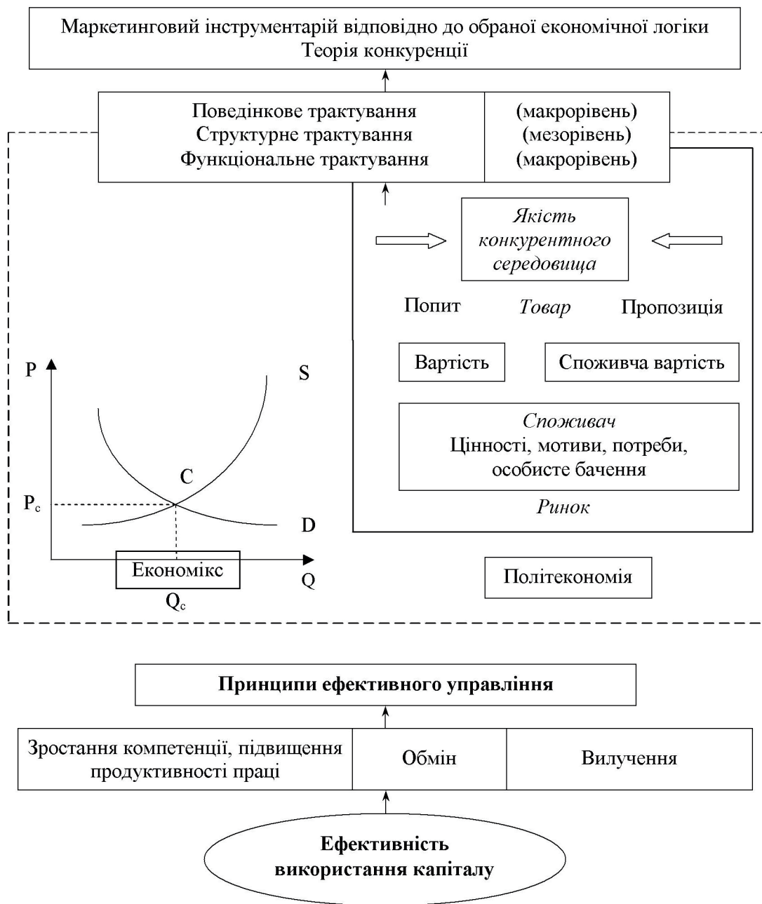
Рис. 1. Маркетинговий інструментарій як похідна від методологічних рівнів маркетингу (авторська розробка)

гових заходів із конкурентними перевагами; найбільш поширеного маркетингового інструментарію (рис. 1). 3) розкрити економічну логіку використання