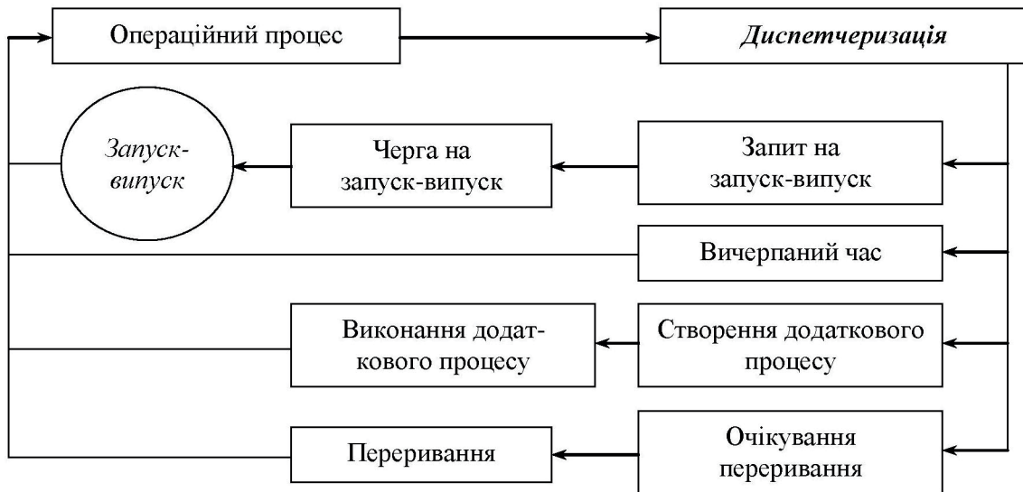
Рис. 1. Система диспетчеризації підприємства

• друга – використовується для ліквідації несправностей, які порушують запланований процес виробництва, але не зривають добового плану випуску продукції;